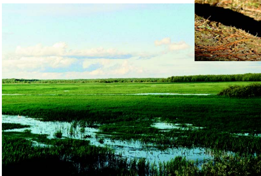
Łąki i pastwiska sąsiadujące z Biebrzą.

tylko Szwecji była oceniana w połowie lat 90. XX wieku na 5000 – 10 000 par. Bernikle kanadyjskie najczęściej widuje się wiosną i zimą na Śląsku oraz w północnej części kraju, gdzie na Żuławach koło Elbląga zimowało w roku 1999 aż 700 tych ptaków. Co ciekawe, ptaki te zimują czasami w obrębie miast, np. widziano je w Toruniu i Cieszynie.