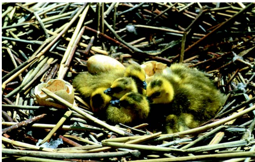
Pisklęta bernikli kanadyjskiej kilka dni po wykluciu.

Pierwotnie bernikla kanadyjska zamieszkiwała Arktykę oraz strefę klimatu umiarkowanego Ameryki Północnej, ale została introdukowana w Europie oraz na Nowej Zelandii. Występuje na nizinnych obszarach mokradlowych, zamieszkując zbiorniki wodne z bujną roślinnością i wysepkami, głównie w pobliżu otwartych terenów, tj. pól uprawnych, pastwisk oraz łąk, gdzie zdobywa większość pożywienia. Bernikla kanadyjska jest uważana za gatunek obcy w naszym kraju w związku z czym nie podlega ochronie. Gniazdo zakłada zazwyczaj na ziemi w pobliżu wody, najczęściej dobrze ukrywając je wśród roślinności, ale zdarza się również, że nie jest ono specjalnie zamaskowane i powstaje na drzewach, półkach skalnych, urwiskach, a nawet tratwach i różnych sztucznych platformach. Zbudowa-