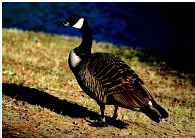
Bernikla kanadyjska w całej okazałości.

renie kraju tylko 9 razy, dlatego też obecność ptak ten ma status gatunku „nielicznie zalatującego”, tzn. takiego, którego obecność w naszym kraju w przeciągu ostatnich dwóch stuleci stwierdzono od 20 do 50 razy. Coraz częstsze pojawianie się tej dzikiej gęsi w Polsce jest efektem zwiększania się populacji sztucznie wprowadzonej w latach 30. XX wieku w Skandynawii. Populacja bernikli w samej