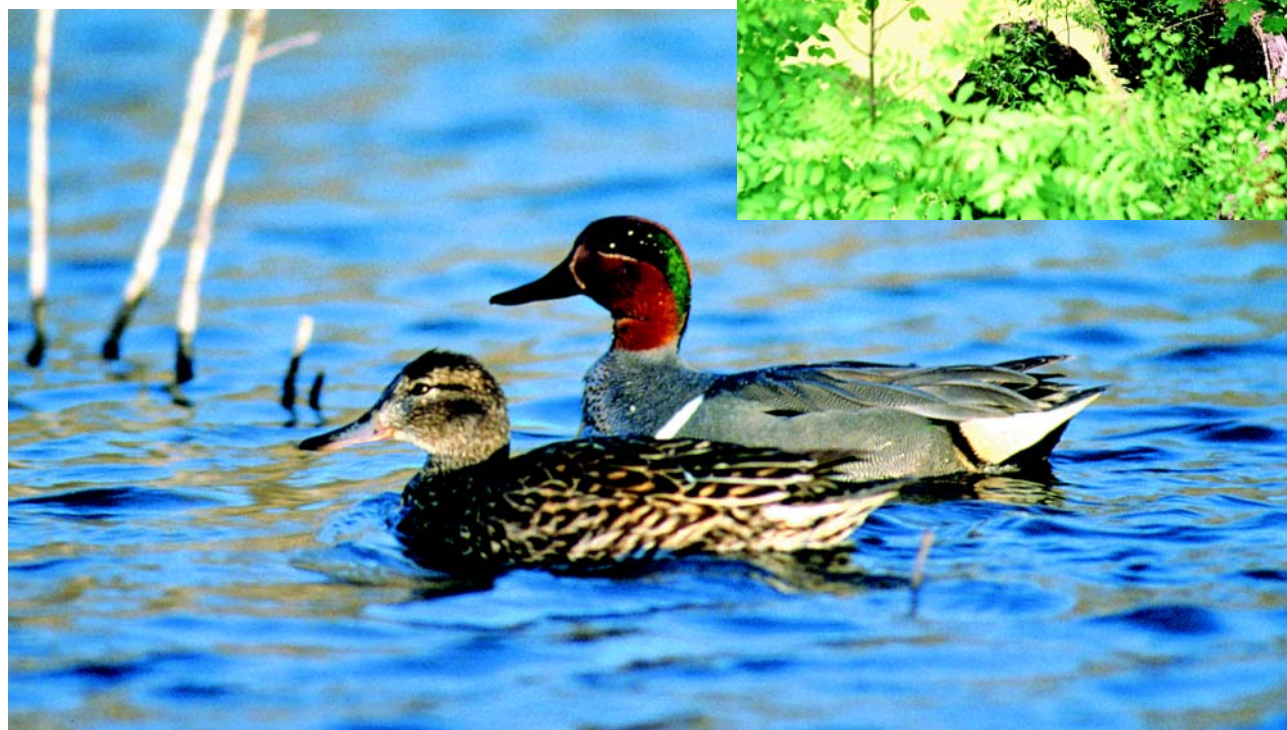
Para cyraneczek.