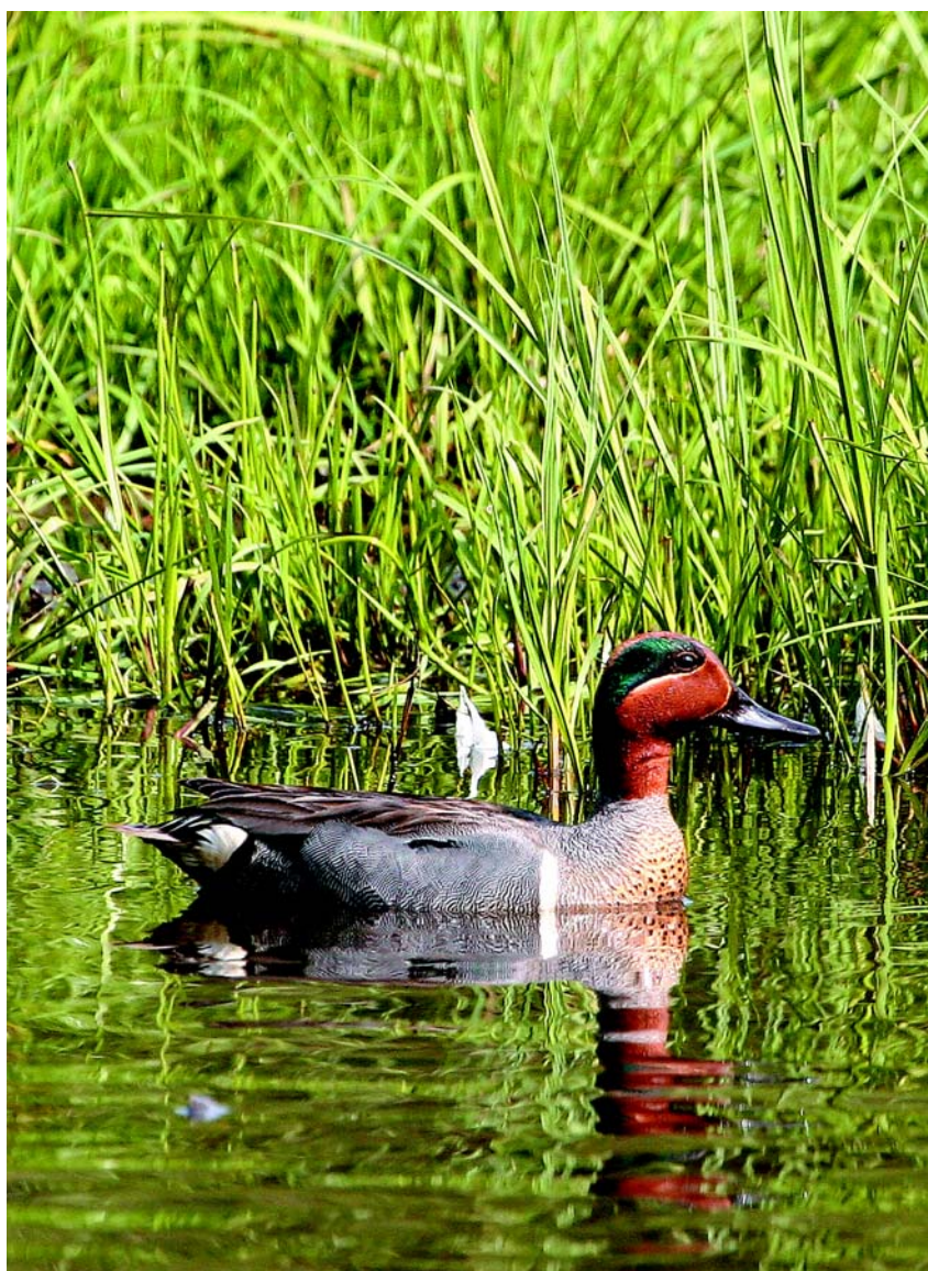
Kaczor cyraneczki w pełnej krasie.

nasiona, pączki i młode pędy roślin wodnych, skorupiaki, ślimaki, małże oraz owady chwytane blisko powierzchni wody lub wybierane z mułu zalegającego w płytkiej wodzie.