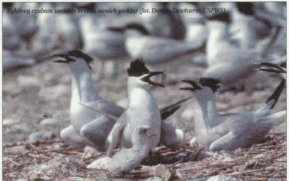
Rybitwy czubate zaciekle bronią swoich piskląt

Dieta tych ptaków składa się z ryb, wodnych bezkręgowców, mięczaków, pierścienic, owadów, a nawet piskląt innych gatunków ptaków. W Polsce rybitwa czubata gnieździ się w okolicach Gdańska oraz na środkowym wybrzeżu. Od zawsze była ona w naszym kraju rzadkim ptakiem lęgowym, a przed II wojną światową spotkano