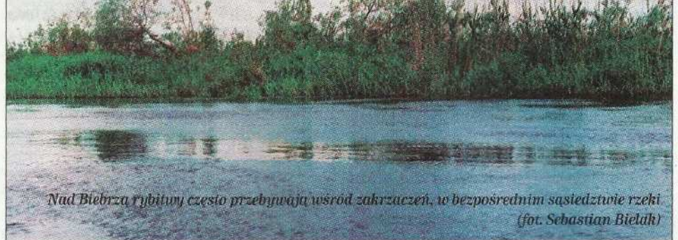
Nad Biebrzą rybitwy często przebywają wśród zakrzaczeń, w bezpośrednim sąsiedztwie rzeki

Rybitwa czubata (z łac. Sterna sandvicensis ) to średniej wielkości ptak wędrowny, którego nazwa gatunkowa pochodzi od nastroszonych, czarnych piór na głowie, tworzących niewielki czub. Długość jej ciała wynosi od 35 do 45 cm, rozpiętość skrzydeł 85-105, ogon 15-17 cm, a masa 184-310 g. Rybitwa czubata gniazduje w Europie (od Szkocji aż po Morze Kaspijskie) oraz w Ameryce Północnej (od wschodnich wybrzeży Ameryki aż po południowe Antyle). Zimuje w basenie Morza Śródziemnego, Czarnego i Kaspijskiego, w zachodniej i południowej Afryce oraz od Morza Czerwonego aż po Indie i Cejlon (podgatunek europejski), a także od Antyli aż po Peru i Urugwaj (podgatunek amerykański). Zamieszkuje głównie morskie wybrzeża oraz ujścia rzek, gdzie najchętniej przebywa na piaszczystych wyspach utworzonych przez nurt wody. W Polsce rybitwa czubata oceniana jest jako gatunek lęgowy (tzn., że zakłada gniazda), ale tylko sporadycznie, a jej gniazda widywano na terenie naszego kraju najwyżej 20-50 razy w ciągu minionych dwóch stuleci. Ptak ten znajduje się w Czerwonej Księdze Zwierząt Giniących i Zagrożonych w Polsce, gdzie ma status gatunku krytycznie zagrożonego wyginięciem – jest objęty ścisłą ochroną gatunkową.